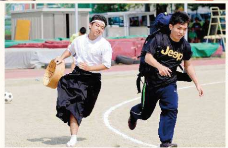
↓クラスパフォーマンス：全学年（ダンス・演劇等）