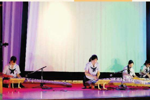
↑文化局発表：音楽部・吹奏楽部・箏曲部