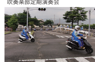
吹奏楽部定期演奏会 二輪車安全運転講習会