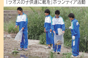
滝沢川清掃ボランティア