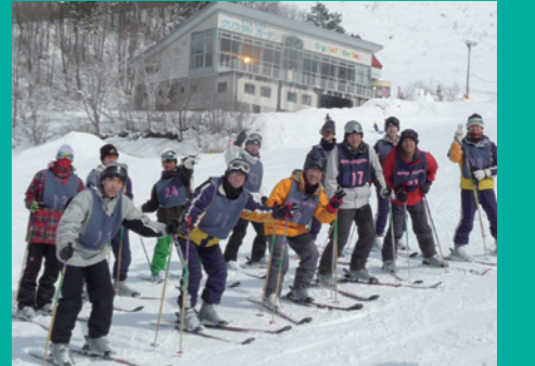
スキー教室(奥志賀)