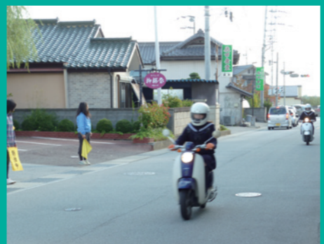
交通安全街頭指導 巨摩高座談会