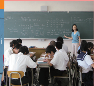
オープンスクール